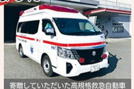
寄贈していただいた高規格救急自動車

市民の方から、高規格救急自動車と高規格救急自動車積載資器材一式を寄贈していただきました。寄贈された高規格救急自動車は、令和6年10月11日から宗像消防署で運用を開始しています。