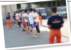
消防署で体験学習する中学生たち。

人の命を救う大切さ、そして大変さを肌で感じることで、これからの人生に役立ててほしいと思います。この中から未来の消防士が誕生してくれることを期待しています。