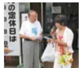
福津市内での街頭キャンペーン

ため、宗像地区事務組合から連絡して状況を探ることもあります。漏水は思わぬ出費を招きます。定期的な点検することを勧めます。 【メーターの確認】 宅内の水道の蛇口を全部閉めた後、メーターボックスのふたを開けて、パイロットの針を見てください。針が回っていないときは、異常はありません。