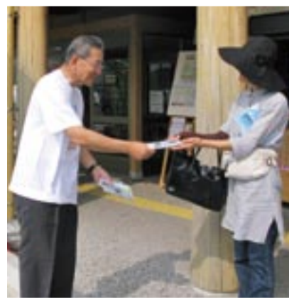
宗像市内での街頭キャンペーン

宗像地区事務組合では、8月の「水道週間」の運動の一環として、水の大切さをテーマに街頭キャンペーンを実施し、地域のみなさんに協力を呼びかけました。