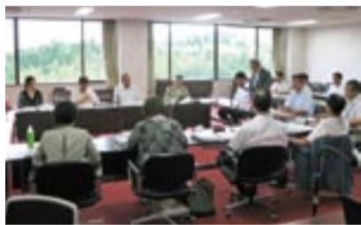
第1回審議会の様子

本年度は、宗像地区の水道事業を事務組合で担う初年度であるため、計画的な歳出抑制、重要政策事業への重点的な財源配分などで、安定的な財政運営に努めます。