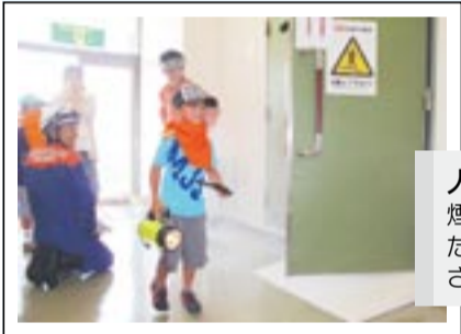
人命検索体験 煙が充満した室内で、たくさんのカードをさがしました。