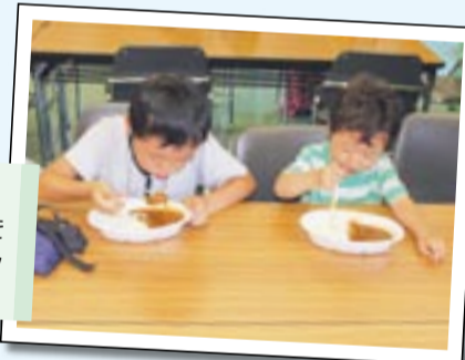
特製カレー試食 消防署特製カレーを参加者全員で試食しました。