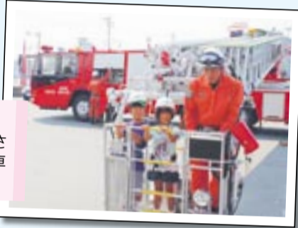
子ども消防士 40メートルの高さまでのびるはしご車に試乗しました。