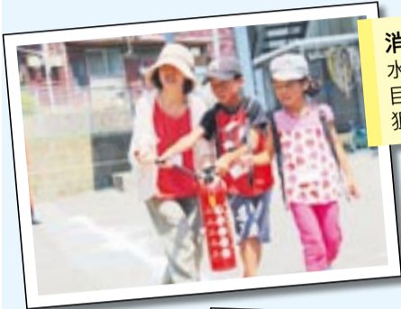
消火訓練 水消火器を使って、目標のゴムボールを狙いました。

8月9日、小学生を対象として、夏の課題授業 in むなかた「めざせ、未来の消防士」を開催しました。15組35人の親子が参加し、さまざまな体験を通して楽しみながら消防の仕事を理解していただきました。