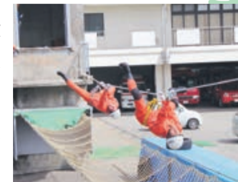
ロープブリッジ救出訓練の様子