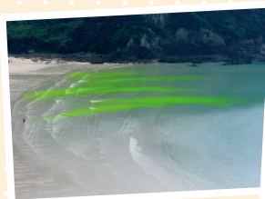
りがんりゅう ようす 離岸流の様子