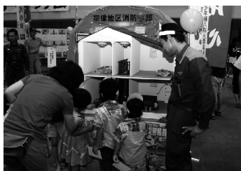
住宅用火災警報器普及啓発