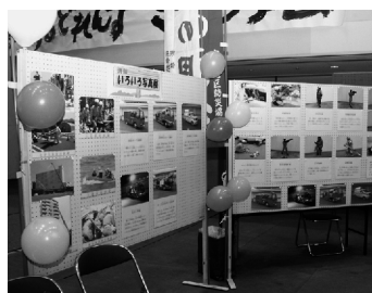
消防署や各種車両を紹介するパネルを展示