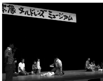
救急隊による応急処置のデモンストラーション