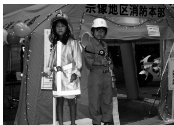
消防服を着て記念撮影

17日 福岡市消防局消防航空隊と合同訓練（宗像市 地島） 福岡都市圏市町消防相互応援協定に基づく航空応援要請時の消防活動を円滑に遂行できるよう、福岡市消防局警防部消防航空隊と合同訓練を実施。