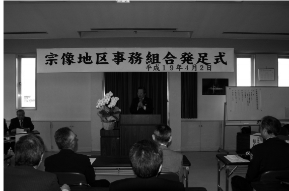
4月2日、宗像自治会館で発足式が行われた。

1日 宗像地区消防組合、宗像自治振興組合、宗像地区水道企業団及び宗像清掃施設組合が統合し、「宗像地区事務組合」がスタート。