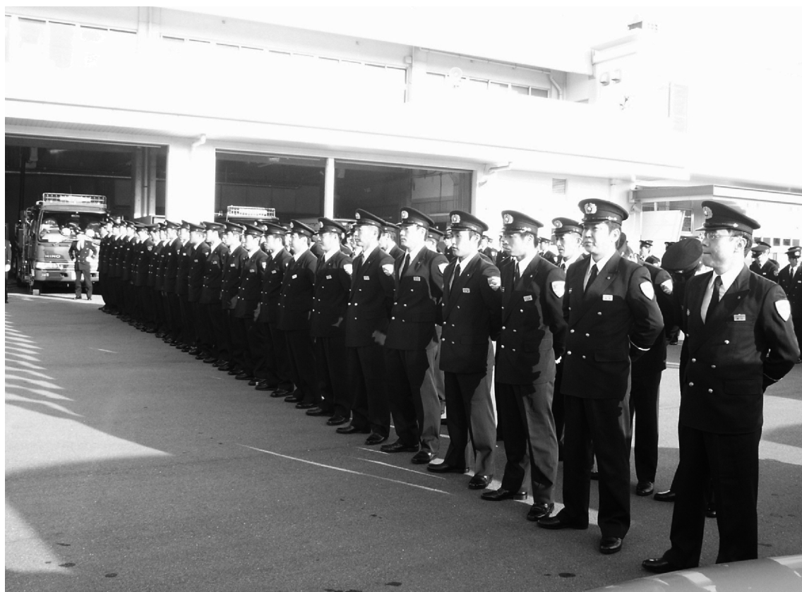
むなかたのしょうぼう