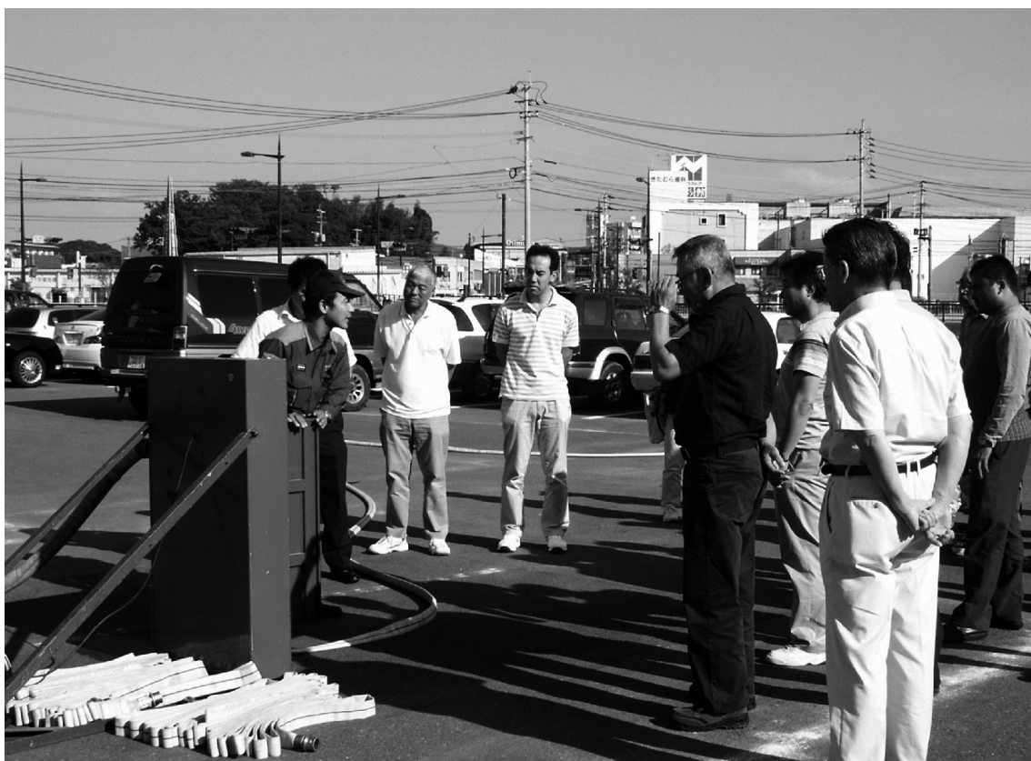
むなかたのしょうぼう