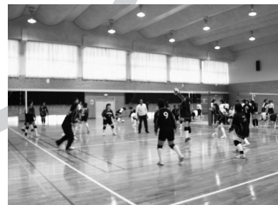
消防ママさん バレーボール大会▶