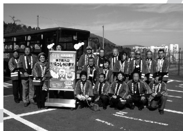
県外防災施設等視察研修