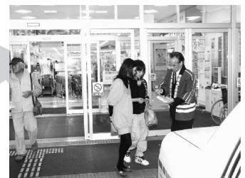
火災予防チラシ配布