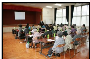
福津市女性防火クラブ 役員研修会