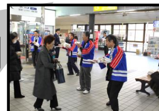
火災予防チラシ配付