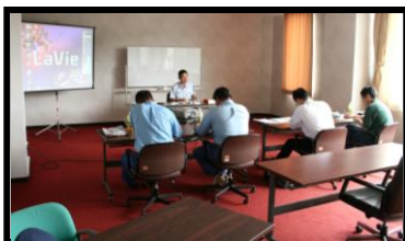
危険物取扱者試験受験準備講習会 (5月、9月、1月実施)