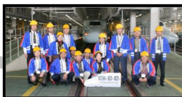
県外防災施設等視察研修