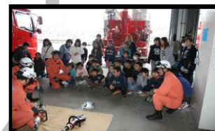
少年消防クラブ体験学習