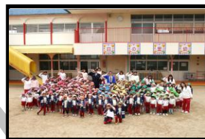
幼年消防クラブ 防火ハッピー着用