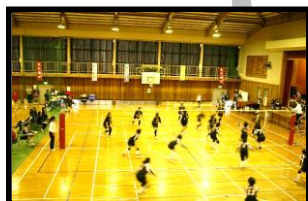
消防ママさん バレーボール大会