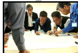
防災マップを活用した活動検討会