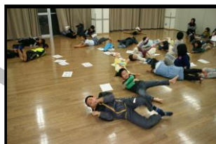
少年消防クラブ防火夜回り 着衣着火時の日の消し方体験 (ストップ、ドロップ&ロール)