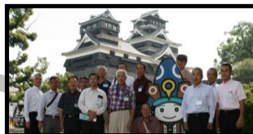
県外防災施設等視察研修