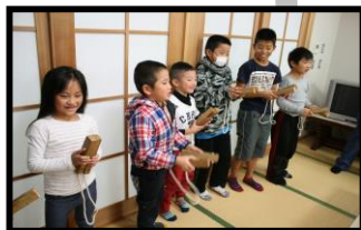
少年消防クラブ防火教室 (拍子木の実演)