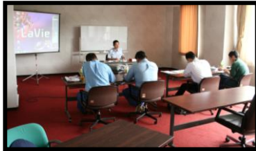
危険物取扱者試験受験準備講習会 (5月、9月、1月実施)