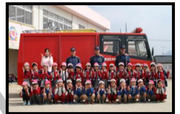
幼年消防クラブ 防火ハッピー着用