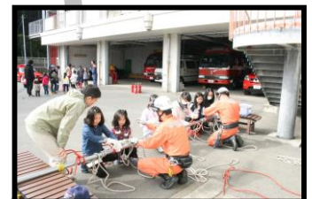
少年消防クラブ体験学習