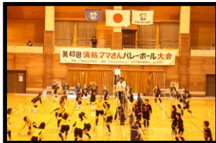
第40回消防ママさんバレーボール大会