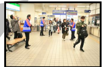
火災予防対策チラシ配付