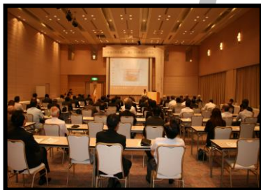
定例総会及び 創立40周年記念式典