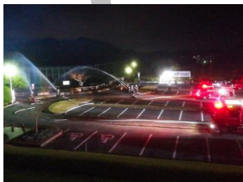
消防団・消防署合同訓練