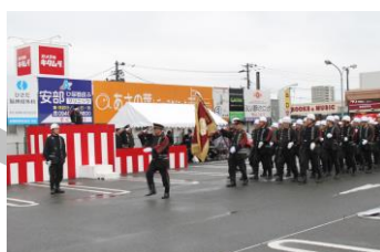
平成30年宗像地区消防出初式