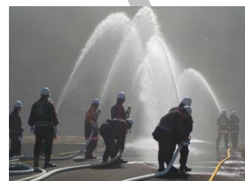
林野火災防ぎょ訓練