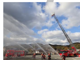
文化財防ぎょ訓練