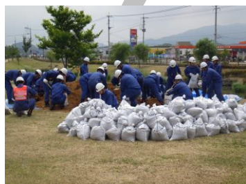
団・署合同水防訓練