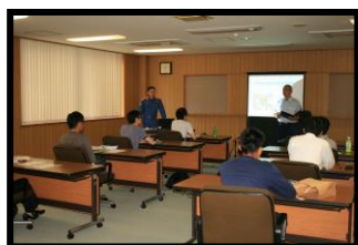
危険物取扱者試験受験準備講習会