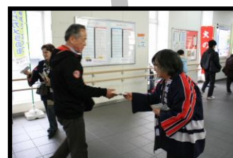
火災予防啓発活動