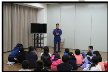
少年消防クラブ防火教室