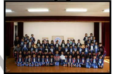
幼年消防クラブ防火ハッピー着用