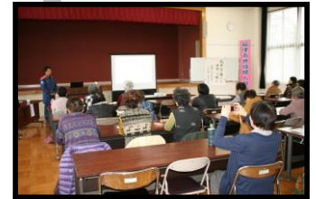
福津市女性防火クラブ役員研修会