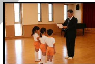
幼年消防クラブへの防火ハッピー贈呈