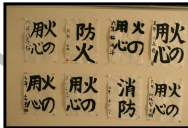
少年消防クラブ防火書道