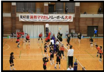
第42回消防ママさんバレーボール大会