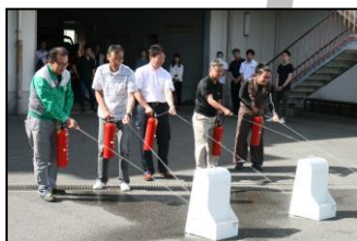
第1回会員研修会 (消火器取扱訓練)