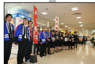
火災予防啓発活動