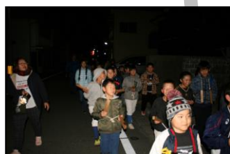
少年消防クラブ防火教室