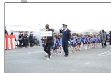
幼年消防クラブ出初式参画