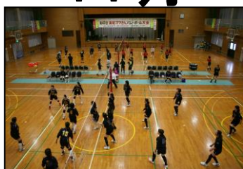
第43回消防ママさんバレーボール大会