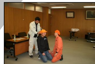
第2回会員研修会 (応急手当訓練)