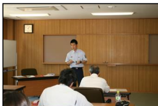
危険物取扱者試験 受験準備講習会