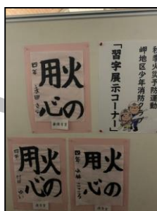
少年消防クラブ防火書道